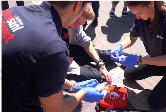
EIN LEBEN RETTEN